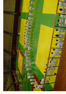
Mai 2008 on me remet à l'INU ma ceinture noire 1 er Dan de Judo