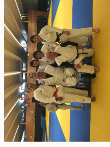
En 2015 je suis invité par l'ambassade du Japon à l'INSEP pour une sensibilisation au Sport Chanbara